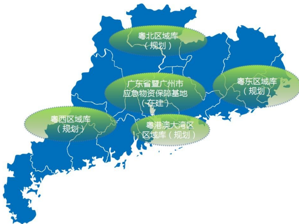
图3 省级应急物资保障基地、区域库布局示意图

统筹仓储设施建设布局。根据各地地理气候、人口规模、经济发展、产业结构的差异，统筹全省各级应急物资仓储设施建设布局，实现不同区域、不同品类物资差异化保障。在粤港澳大湾区重点区域以及多灾易灾、偏远地区推进综合性应急物资区域库建设，强化区域辐射效应，提升应急响应效率。