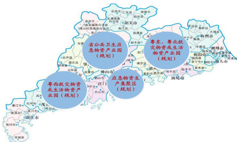
图1 产业园、产业集聚区规划示意图

推进应急物资产业基地建设。注重产储结合，优化产能布局，充分发挥制造业大省优势，培育若干个综合性、专业性应急物资产业园。发挥骨干企业、高新技术企业引领带动作用，打造应急物资全产业链，形成集聚效应。